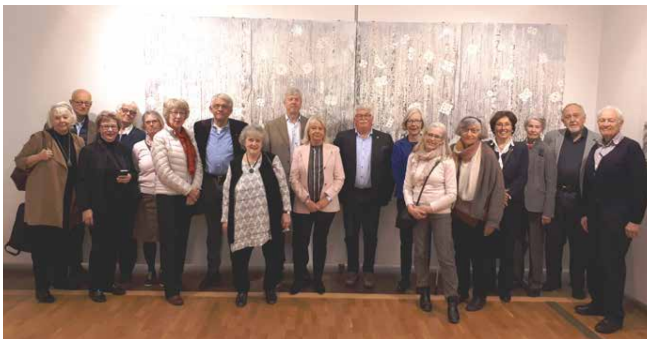
En björkskog av Lars Lerin var en av de konstupplevelser som gav atmosfär åt Vännernas utfärd till Karlstad.