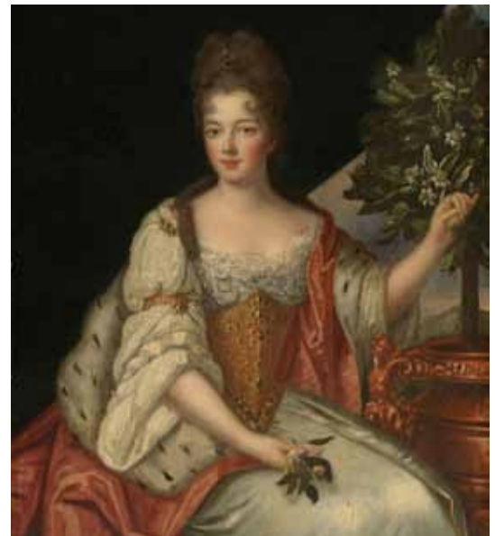
Louise Bénédicte de Bourbon, hertiginna av Maine, i ett porträtt efter Gobert, cirka 1690.

Son of Heaven spelas i Bröllopsalen på Vadstena slotts andra våning. Speldatum: 17, 20, 21, 23, 24, 26, 27, 30, 31 juli samt 2, 3, 5 augusti kl. 19.00. Son of Heaven sjungs och textas på originalspråket engelska. Svenskt synopsis finns i programboken. Operan är cirka 2.45 h lång inklusive en paus. Biljetterna släpps den 1 april.