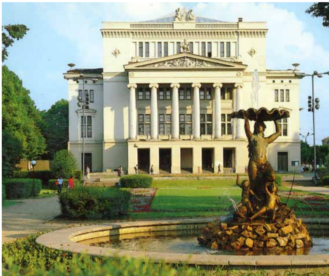
Lettiska Nationaloperan i Riga.

Den gamla Hansastaden Riga, kulturhuvudstad 2014, kan bjuda på många upplevelser för den musik- och konstintresserade. Vi räknar naturligtvis med besök på den vackra