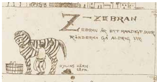
Illustration till Zebran ur ABC-boken, utgiven på 1880-talet, av biblioteksmannen och litteraturhistorikern Ernst Meyer.