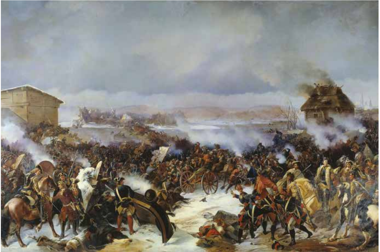
Slaget vid Narva, målning av Alexander Kotzebue, rysk, 1846.