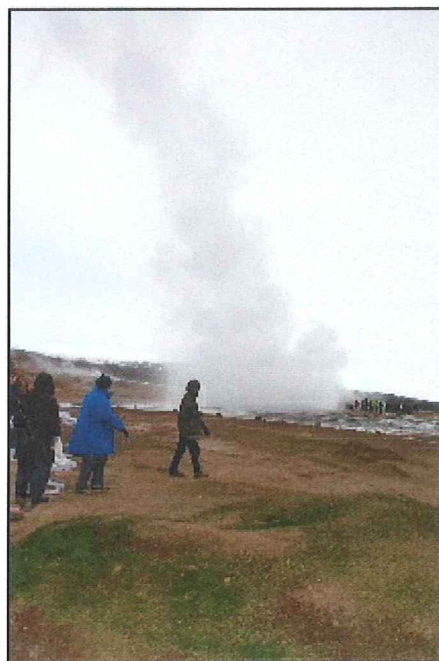
En av Geysirs naturliga fontäner