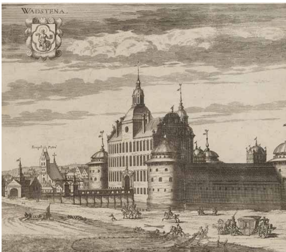
Vadstena slott i Suecia Antiqua et Hodierna .

Vårt medlemsantal håller i sig men visst kan vi bli många fler! Värva era familje-