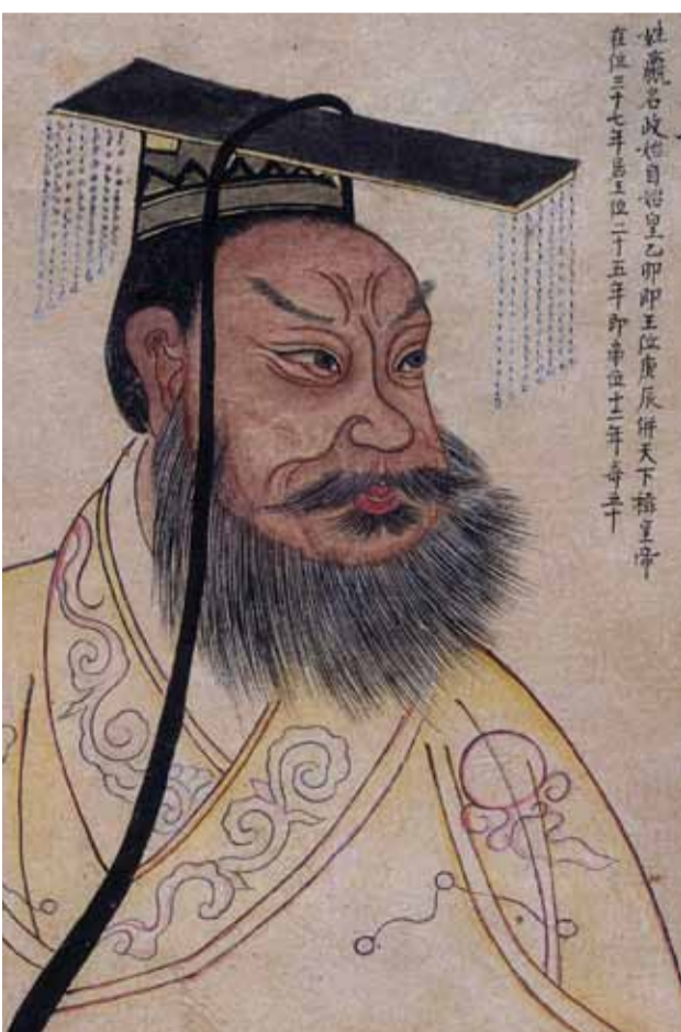
Kejsaren Shi Huangdi – Himlens son.